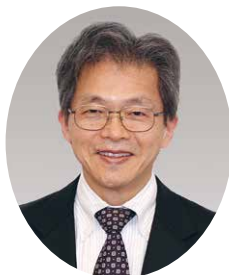
ベル・データ株式会社