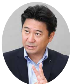
日本アイ・ビー・エム株式会社

IBM、エバンジェリスト、開発者グループの代表という立場から、その歴史の中で、変わったもの(機能)、変わらないもの(価値)を紐解き、今後もIBM i がDXの基盤として最適であることを証明し、そしてそれを支える開発リソース/団体があることをご説明いたします。